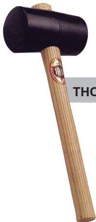
THOR ค้อนยางสีดำ