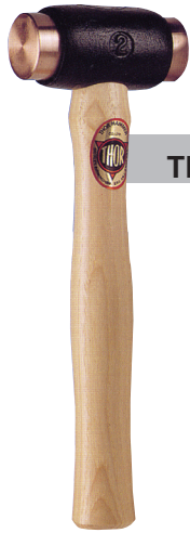
THOR ค้อนทองแดง