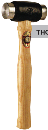
THOR ค้อนลูมิเนียม