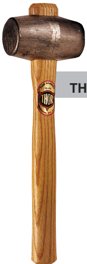
THOR ค้อนตะกั่ว