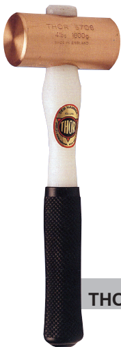
THOR ค้อนทองแดงล้วน หัวกลม