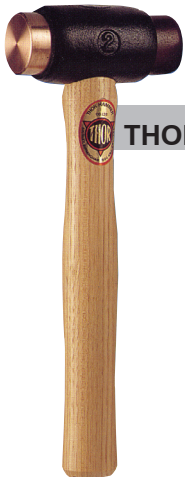
THOR ค้อนทองแดงข้าง หนึ่งข้าง