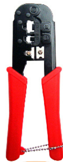
2 ช่อง 8P 6P