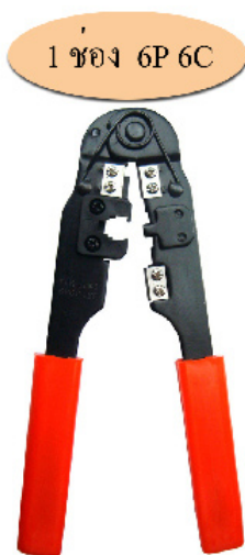
1 ช่อง 6P 6C