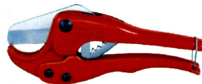
TYPE:L-42A (Cutting Dia 1 3/8")