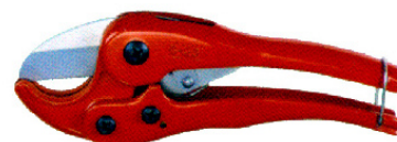
TYPE:S-25 (Cutting Dia 1")