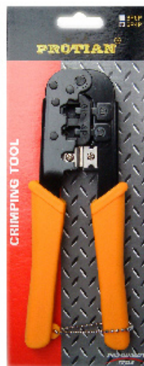
2 ช่อง 6P 4P