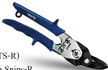
Figure Tin Snips-R