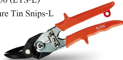
Figure Tin Snips-L